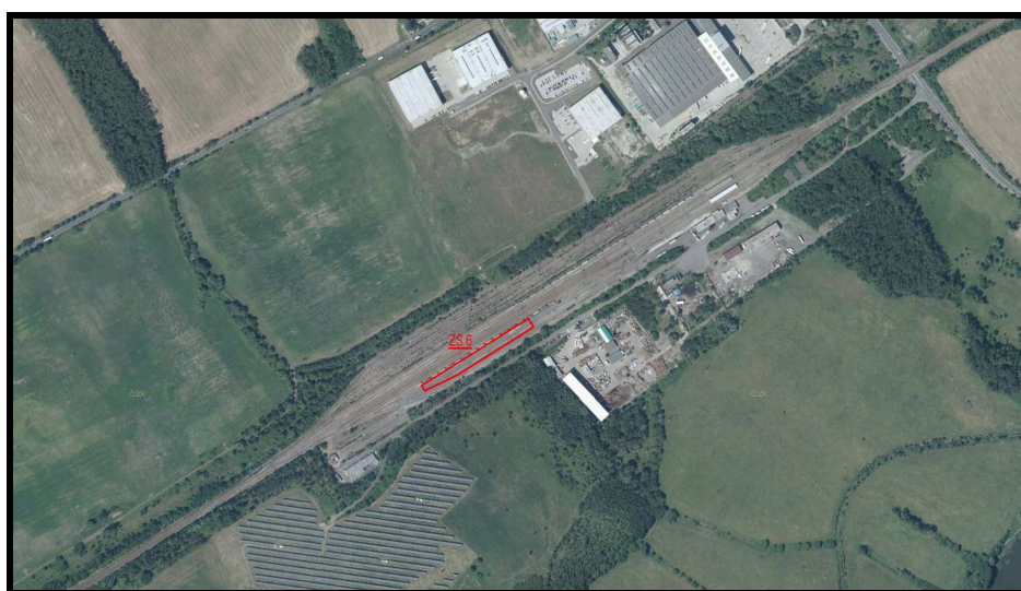
Obrázek č. 1 – Umístění recyklační základny v obvodu žst. Chabařovice

Recyklovány budou pouze odpady kategorie OSTATNÍ, tj. šterk ze železničního svršku.